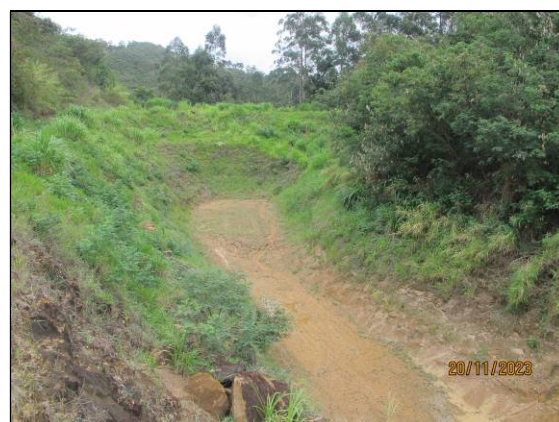
5- Registro de 20/11/23 – Reservatório “seco” - Percentual de assoreamento: 0,00%.