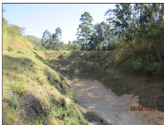
Figura 3- Registro de 08/09/23 – Vista da condição do reservatório do dique D-03, após a operação de desassoreamento (“seco” e na capacidade máxima de armazenamento - Percentual de assoreamento: 0,00%).