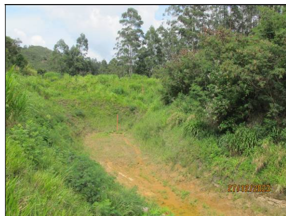
6- Registro de 27/12/23 – Reservatório “seco” - Percentual de assoreamento: 0,00%.

Em tempo, colocamo-nos a disposição para outros esclarecimentos que se fizerem necessários.