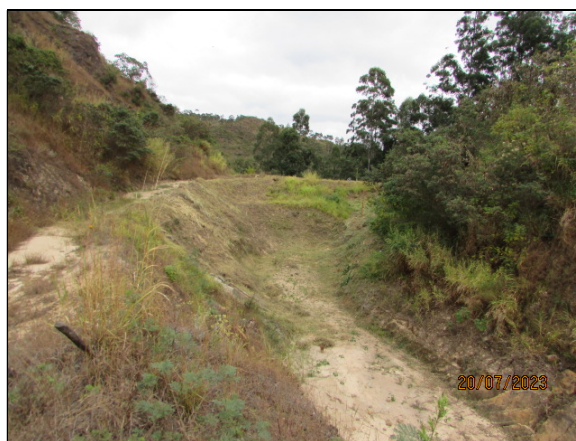
1- Registro de 20/07/2023– Reservatório “seco” – Percentual de assoreamento: 1,50%.