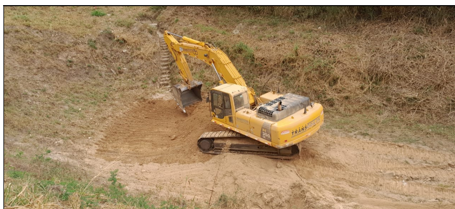
2- Registro de 25/08/2023– Operação de desassoreamento anual do reservatório Percentual de assoreamento: 1,50%.