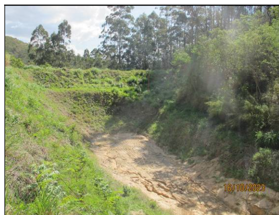
4- Registro de 16/10/23 – Reservatório “seco” - Percentual de assoreamento: 0,00%.